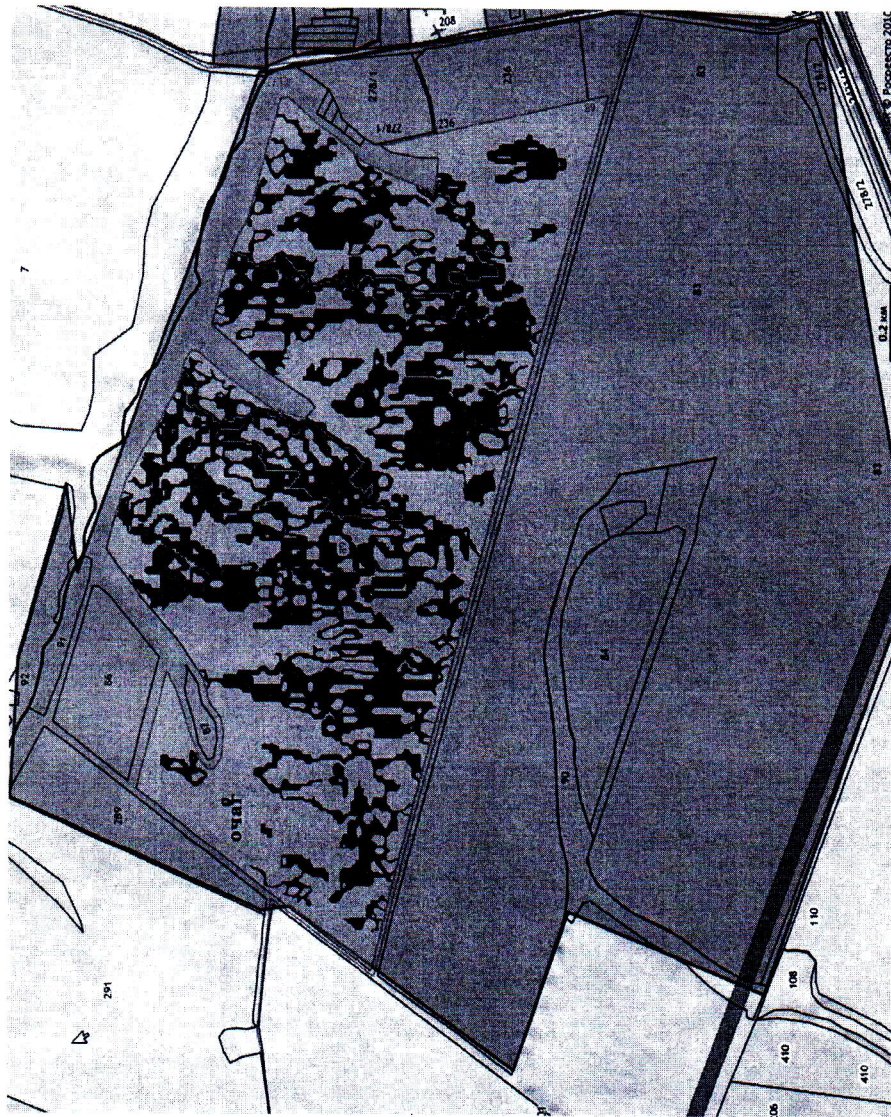
Схема границ карантинной фитосанитарной зоны по повилке ( Cuscuta L. ) площадью расположенной по адресу: Тульская область, Ефремовский район, МО. Козьминское

Приложение 1 к приказу Управления Россельхознадзора по городу Москва, Московской и Тульской областям от 24.09.2024 № 922